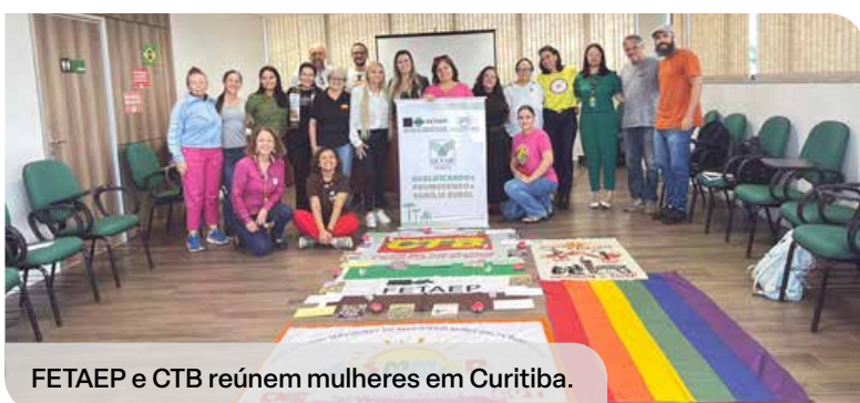
FETAEP e CTB reúnem mulheres em Curitiba.

A Federação reafirma seu compromisso com a valorização das mulheres do campo, atuando na formação, na organização sindical e na defesa de direitos. Fortalecer a participação das mulheres é essencial para o desenvolvimento da agricultura familiar e para a construção de um meio rural mais justo e sustentável.