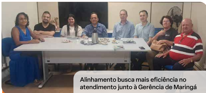
Alinhamento busca mais eficiência no atendimento junto à Gerência de Maringá