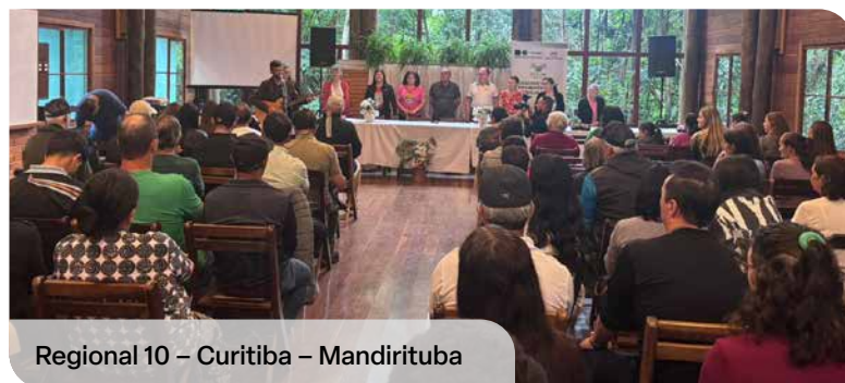
Regional 10 – Curitiba – Mandirituba