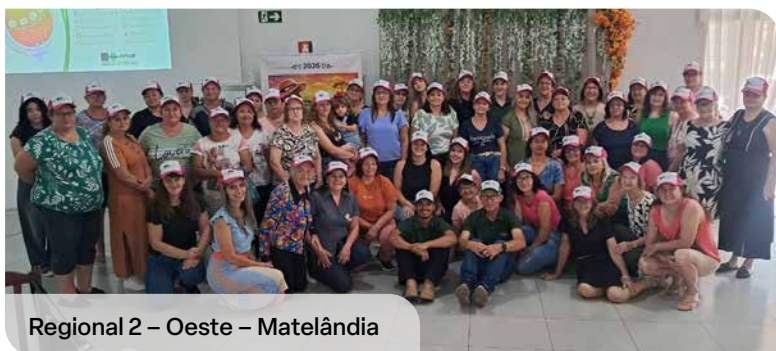
Regional 2 - Oeste - Matelândia

“Quando a mulher tem acesso à informação e formação, ela se fortalece, participa mais e passa a ocupar espaços de decisão, seja na propriedade, na comunidade ou no Sindicato” destaca.