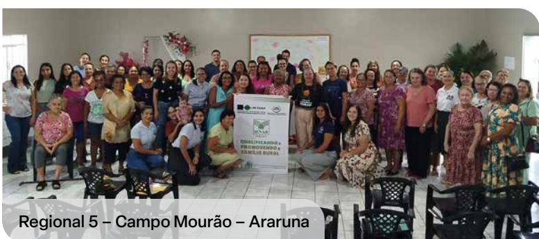
Regional 5 - Campo Mourão - Araruna