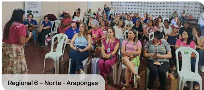
Regional 6 – Norte - Arapongas