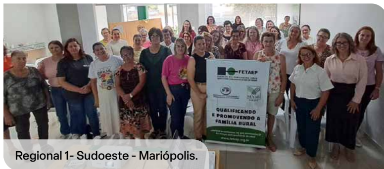
Regional 1- Sudoeste - Mariópolis.