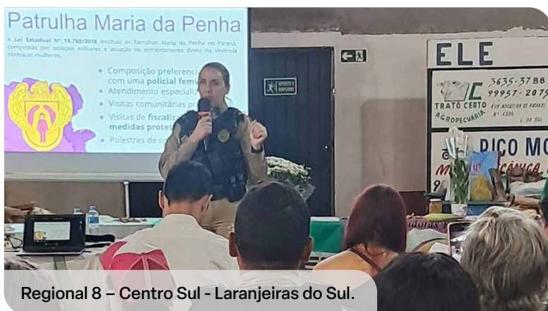
Regional 8 – Centro Sul - Laranjeiras do Sul.

Mandirituba, Agudos do Sul, Teixeira Soares, Tijucas do Sul, Araucária, Contenda e Almirante Tamandaré