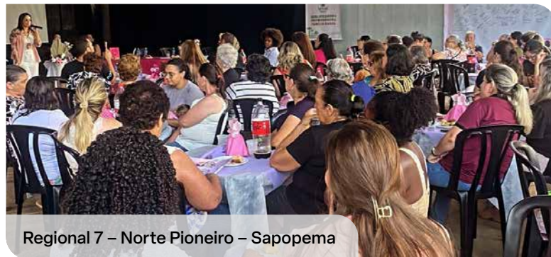
Regional 7 – Norte Pioneiro – Sapopema