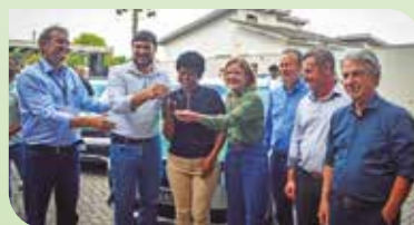
Regional Campo Mourão

A ministra Gleisi Hoffmann destacou que a sustentabilidade do país passa pela agricultura familiar. “Não podemos falar de sustentabilidade se não tivermos uma agricultura familiar estruturada, com melhores condições de vida no campo. Precisamos dar motivos para que os filhos dos agricultores permaneçam na terra”, afirmou.