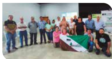
Regional Norte - Astorga