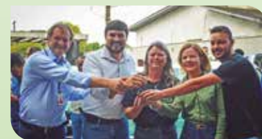
Regional Centro Sul