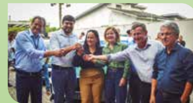
Regional Norte Pioneiro