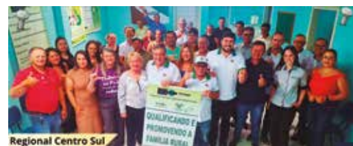
Regional Centro Sul