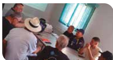
Regional Noroeste Paranaíba