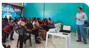
Regional Centro Sul (Rio Bonito do Iguaçu)