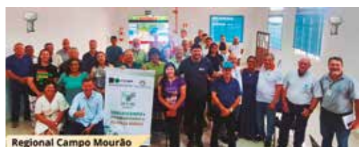
Regional Campo Mourão