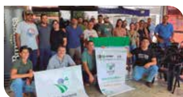
Regional Campo Mourão

A proposta é garantir que todas as etapas do projeto estejam alinhadas à realidade dos territórios, fortalecendo a gestão, a sustentabilidade e o desenvolvimento das organizações da agricultura familiar no Paraná.