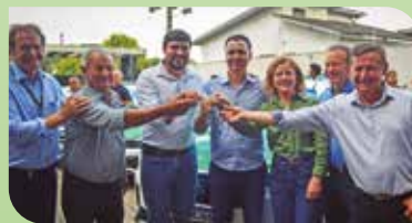
Regional Noroeste Umuarama