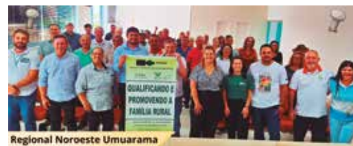
Regional Noroeste Umuarama