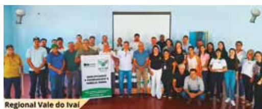
Regional Vale do Ivaí