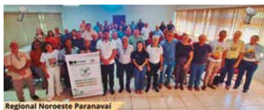
Regional Noroeste Paranavaí