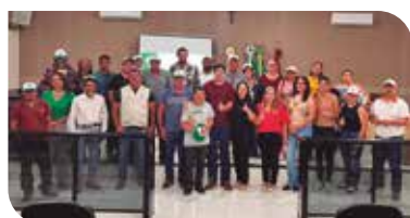
Regional Norte Pioneiro