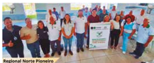
Regional Norte Pioneiro