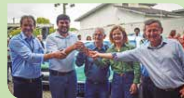
Regional Noroeste Paranaíba