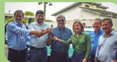
Regional Vale do Ivaí