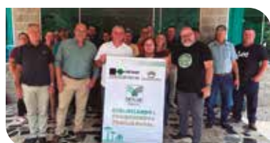
Regional Curitiba - Contenda