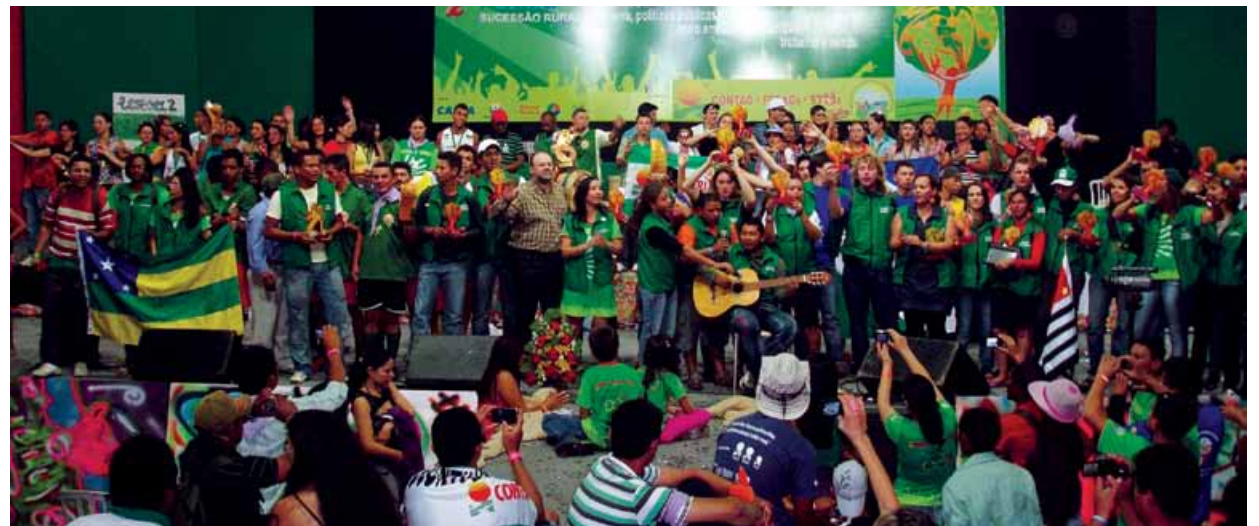
Encerramento - Cada Estado com uma lembrança feita pelos jovens paranaenses.

Dois jovens de Ortigueira desenvolveram as lembranças: um fez a escultura e o outro a pintura