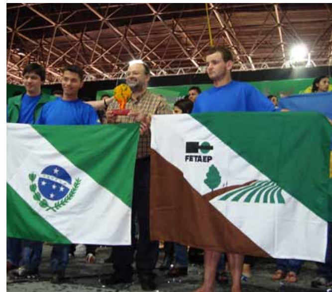
Jovens paranaenses de Ortigueira homenageados pela elaboração das lembranças que simbolizaram a 2ª edição do Festival Nacional.

Além deles, a carta também foi encaminhada ao ministro do Trabalho e Emprego, Carlos Lupi, e ao ministro da Educação, Fernando Haddad.