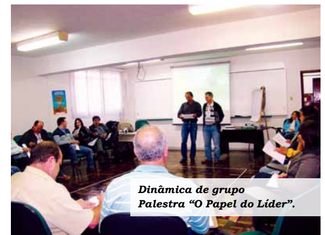
Dinâmica de grupo Palestra “O Papel do Líder”.

A Fetaep aproveitou a presença dos gestores municipais para inserir na programação a palestra do assessor da Regional Sul da Contag,