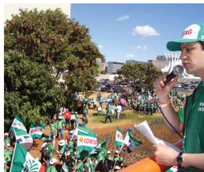
Jovens rurais lutam em Brasília por melhores condições de trabalho no campo.