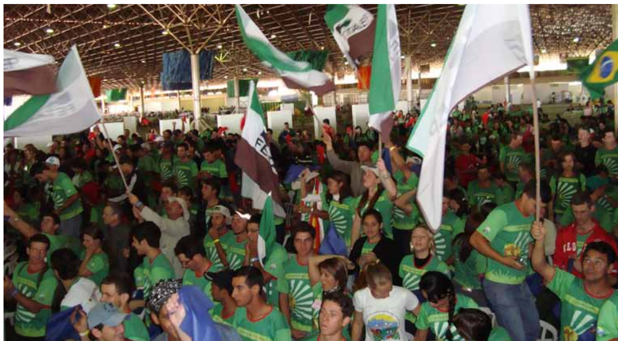
Abertura das atividades - Parte da comitiva paranaense.

Sociedade civil, imprensa e órgãos do governo olharam o movimento de forma diferenciada