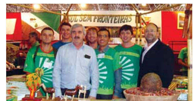
Barraca com produtos típicos da Região Sul.

Esportes - As competições esportivas foram realizadas nos dias 29 e 30. As modalidades englobaram as seguintes atividades: futebol, futsal, voleibol e sinuca, salto em distância, atletismo (corrida de 100 metros) e natação. Todas nas categorias contaram com a participação do público feminino e do masculino.