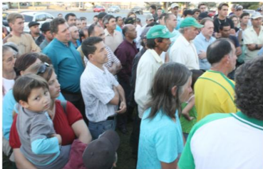
Mobilização dos Trabalhadores/as de vários municípios do PR para irem até a assembleia do Sindflorestal votarem contra a nova entidade.