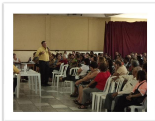
Seminário Região 03 – Umuarama