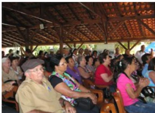
Seminário Região 04 – Paranavaí