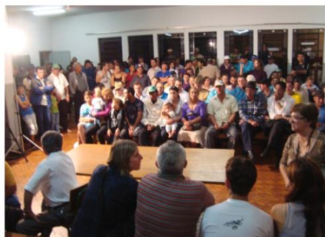
Aguardando o início da Assembleia