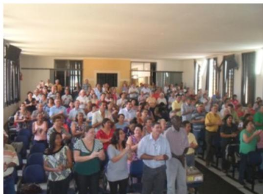
Seminário Região 06 - Guaraci