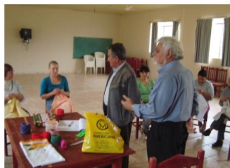
Em Bela Vista da Caróba, no local e horário onde deveria acontecer a assembleia só acontecia uma reunião do grupo de mãe da cidade que não sabiam de tal convocação para fundação de sindicato.