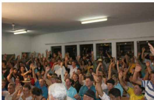
Trabalhadores/as votando contra essa nova entidade, não fundada por unanimidade