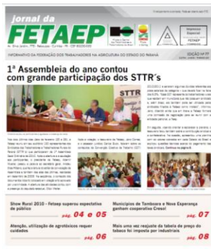
Janeiro / Fevereiro