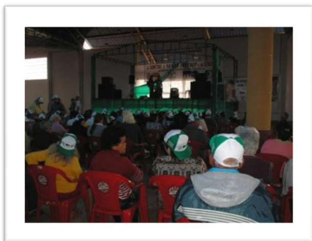
Seminário Região 02 – Assis Chateauriand

A ação de agentes financeiros que vem pressionando os segurados a abrirem conta corrente ao invés de conta benefício em sua agencias, tem gerado grandes transtornos aos sócios e STTR's, uma vez que aberta a conta o banco passa a cobrar taxa mensal de manutenção que vem descontado do benefício, assim como a mensalidade social do aposentado; os agentes financeiros alegam que as taxas são todas referente ao sindicato e induzem o segurado a cancelar a contribuição social. Além das tentativas de transformar os Sindicatos correspondentes bancários, prejudicando assim a idoneidade da entidade sindical.