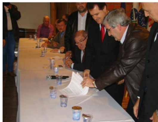
Lançamento do Cadastro dos Segurados Especiais – Cascavel, 28 de maio de 2010.