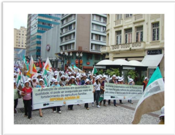
Marcha das Mulheres – Curitiba