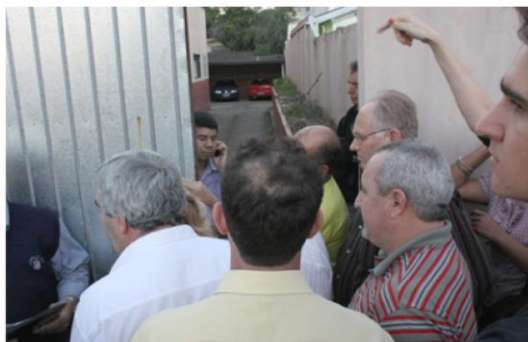
Chegada na assembleia com 400 trabalhadores/as, onde fomos recebidos com o fechamento dos portões da entidade