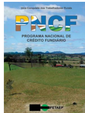
(Cartilha em desenvolvimento)