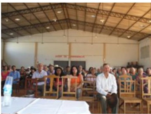
Seminário Região 09 – Jardim Alegre