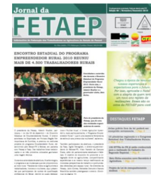
Novembro / Dezembro