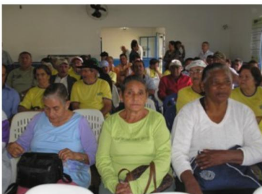
Seminário Região 07 – Ibaiti