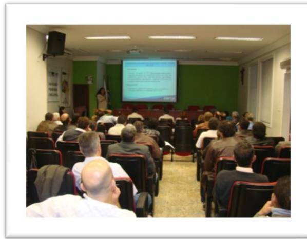
Encontro sobre Habitação Rural – FETAEP, junho de 2010.

Num primeiro momento a Caixa apresentou a normativa dos grupos II e III do Programa Nacional de Habitação Rural – PNHR , e trouxe um pouco da atual situação do programa no Estado. A CONTAG enfatizou os avanços alcançados com as negociações e Grito da Terra, bem como seus encaminhamentos junto ao Ministério das Cidades e Caixa Econômica Federal. Por fim, houve a apresentação da experiência da FETAG/RS em trabalhar a habitação via cooperativa – COOHAF.