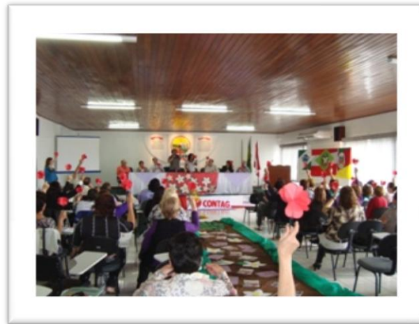
Encontro Regional Sul de Mulheres

Foi realizado também um Seminário da Região Sul de Mulheres Trabalhadoras Rurais na FETAESC – SC, onde as comissões dos três estados puderam fazer um intercâmbio das experiências e ações de cada estado, planejamento para 2011 a nível Estadual e de Regional Sul e também o Lançamento da Marcha das Margaridas 2011. No Paraná o lançamento aconteceu na Assembleia de dezembro.