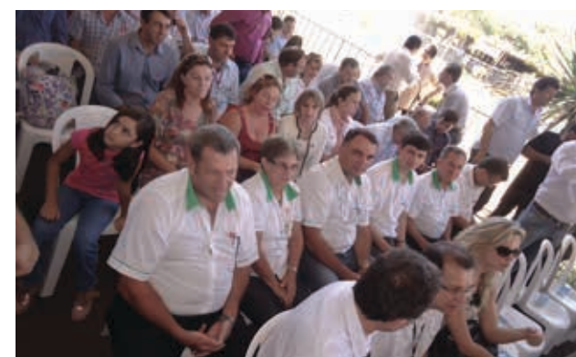
Diretores da Fetaep e da Regional 02 durante a solenidade de abertura do Show Rural com a presidenta Dilma.

Cascavel - No primeiro dia de Show Rural Coopavel, 04 de fevereiro, a presidenta da República Dilma Rousseff, juntamente com ministros, senadores, deputados, governador, prefeitos, vice-prefeitos, vereadores, cooperativistas e sindicalistas, participou da solenidade de abertura oficial do evento. O presidente da Fetaep, Ademir Mueller, que foi cumprimentado pela presidenta em seu discurso, participou da cerimônia no palco com as demais autoridades.