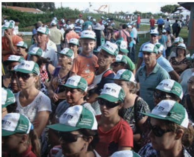
Público interessado em adquirir novos conhecimentos.