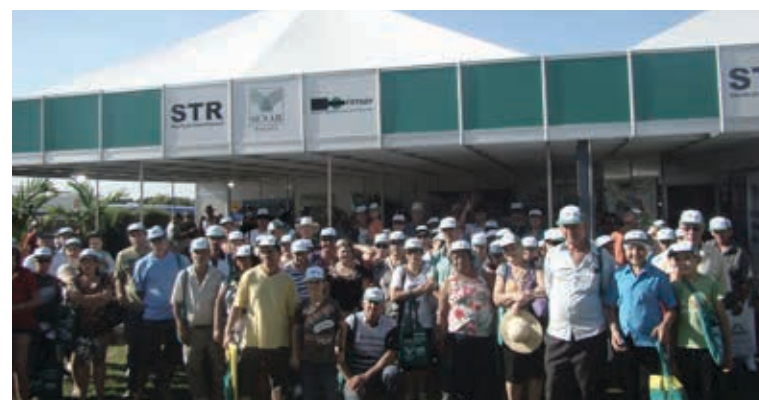
Estande da Fetaep no Show Rural.

É com as energias renovadas que iniciamos mais um ano de luta e de muito trabalho.