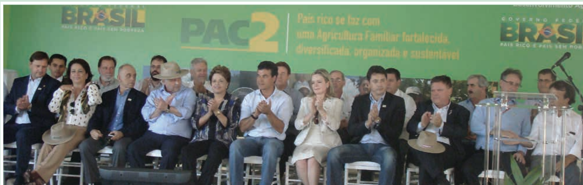
A presidenta da República Dilma Rousseff, juntamente com ministros, senadores, deputados, governador, prefeitos, vice-prefeitos, vereadores, cooperativistas e sindicalistas, participou da solenidade de abertura oficial do Show Rural 2013.