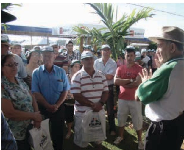
Orientações aos trabalhadores sobre o Show Rural e também sobre o Movimento Sindical.