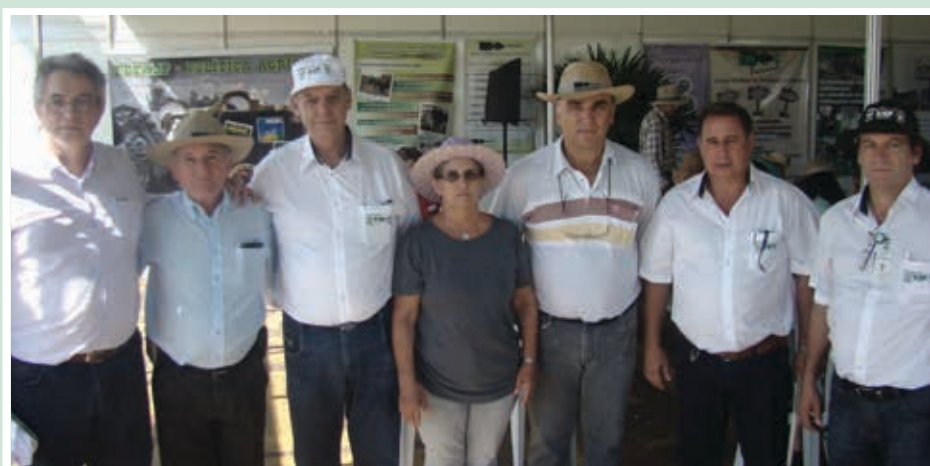
Fetaep recebeu a visita da Faep e do Senar em seu estande.