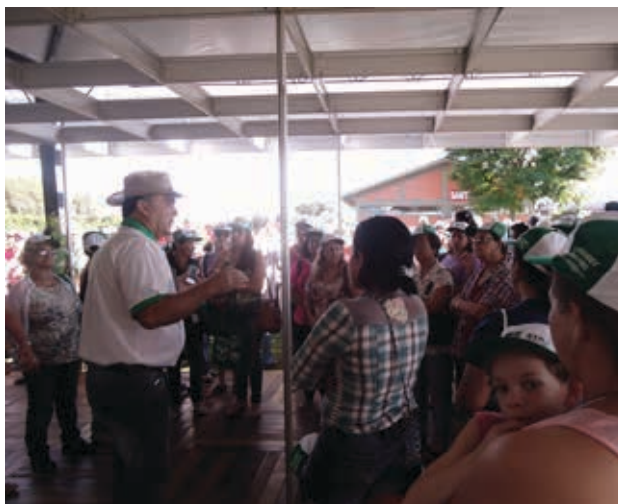
Diretores da Fetaep se revezaram para dar conta das mais de 150 caravanas.

Com informações de Aline Cambuy, enviada especial ao Show Rural.