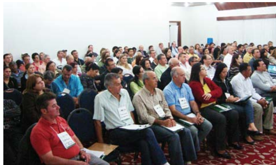
Participantes da Executiva de Maringá

Histórico da Lei - A 11.718 surgiu do relatório da Medida Provisória 410/07 elaborado pelo deputado federal, Assis do Couto. Para ele, a Lei representa uma enorme conquista para os trabalhadores rurais do Brasil, primeiramente para os informais, que são mais de 3,5 milhões em todo o país.