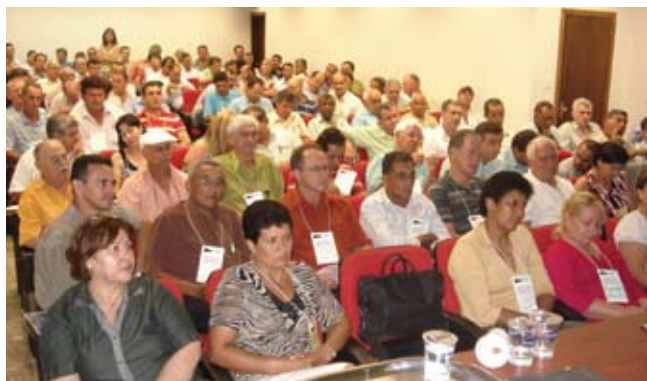
Assembleia foi composta por participantes de todo o Estado