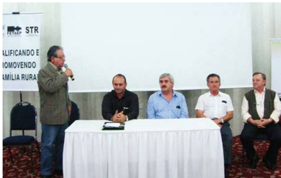
Secretário geral da Fetaep esclarece dúvidas de dirigentes sindicais e de funcionários referente à Lei 11.718/08

Em 2009, a Fetaep realizou quatro grandes eventos no Estado visando capacitar e esclarecer dúvidas dos funcionários e dirigentes sindicais referente à interpretação das leis previdenciárias dos rurais e ao cadastramento e declaração anual dos agricultores familiares - conforme prevê a Lei 11.718. Devido algumas mudanças na Lei, a Fetaep instruiu 460 membros dos sindicatos da base das Gerências Executivas de Maringá, Cascavel e Londrina, além de Ponta Grossa e Curitiba. Os eventos tiveram a duração de dois dias em cada região.