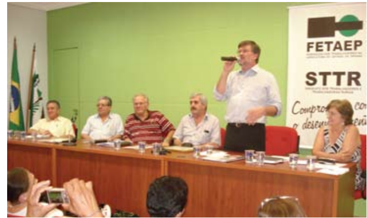
“É uma honra receber esse certificado. Fico muito feliz e engrandecido”, destacou o deputado