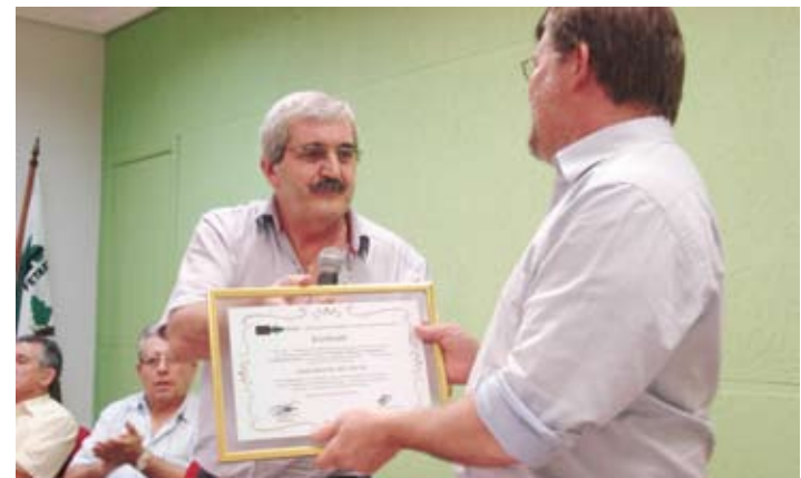
O deputado foi o primeiro a receber o título

O deputado não pode deixar de comentar sobre o atual cenário político do país que, mais uma vez, passa por uma crise ética. “É lamentável o nível que estamos atingindo na política brasileira. Isso é vergonhoso e denigre a imagem daqueles que fazem a política correta e justa”, explanou.