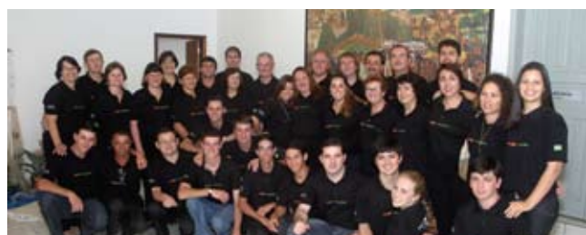
Turma que participou da ENFOC