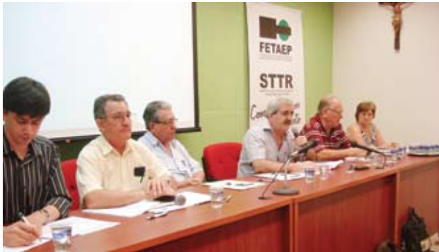
Última Assembleia Geral Ordinária e Extraordinária do ano reuniu mais de 130 dirigentes sindicais na Fetaep