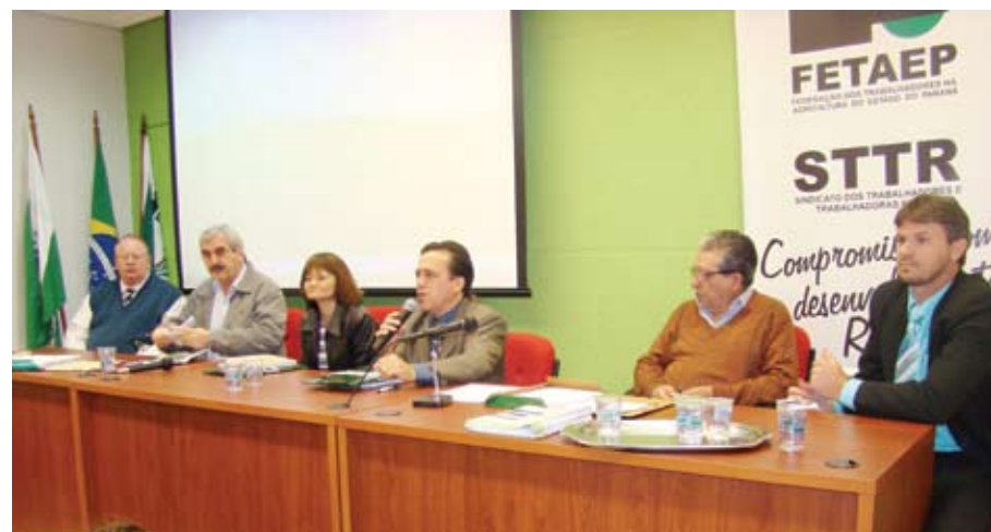
Seminário na Fetaep para a base de Curitiba e Ponta Grossa