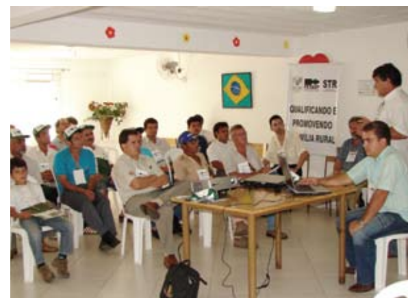
Negociações para a instalação de um PAC foram iniciadas durante a oficina