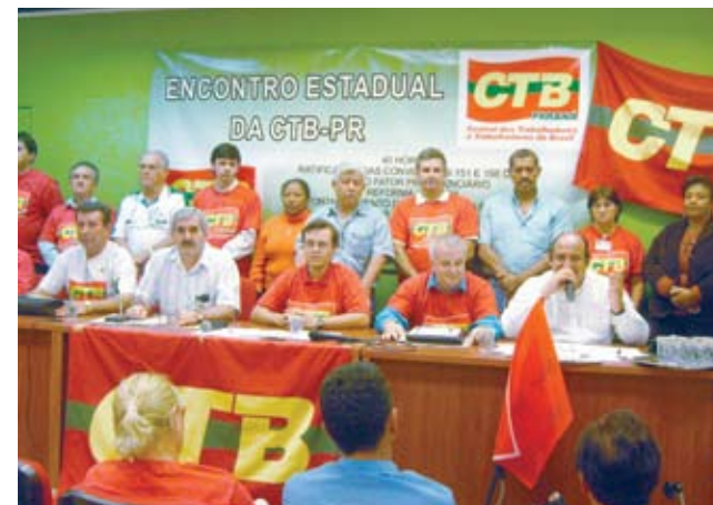
Nova diretoria da CTB-PR tem vários integrantes do MSTTR