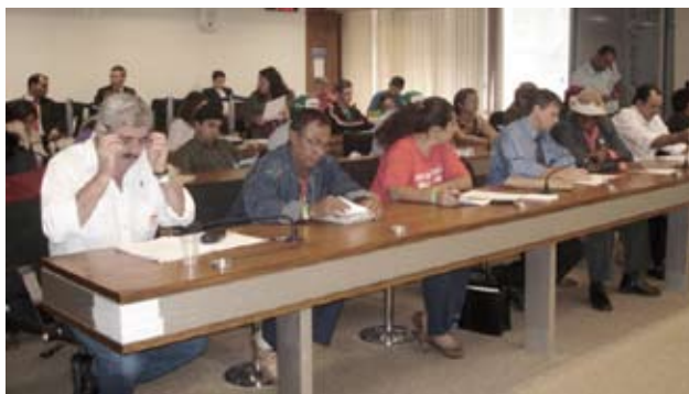
Várias audiências com representantes do governo federal foram realizadas durante o Grito

O presidente Lula garantiu que os índices de produtividade rural serão atualizados neste ano. Já a meta de assentamento para 2008 foi estabelecida em 100 mil famílias pelo Incra e 20 mil pelo PNCF.