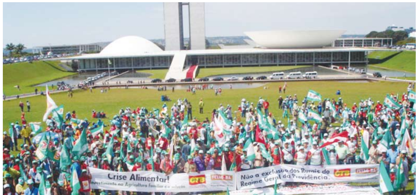
Manifestantes em frente ao Congresso Nacional

Cerca de 10 mil trabalhadores e trabalhadoras rurais de todo o País participaram do 14º Grito da Terra Brasil (GTB), principal mobilização de massa do Movimento Sindical dos Trabalhadores e Trabalhadoras Rurais (MSTTR). O evento é organizado pela Contag com apoio das Federações Estaduais de Trabalhadores na Agricultura e Sindicatos de Trabalhadores Rurais.