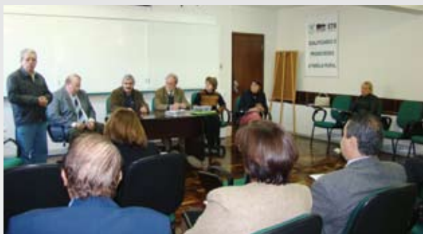
Encontro foi realizado com objetivo de estreitar relacionamento entre as instituições

Representantes da Fetaep e da 16ª Junta de Recursos da Previdência Social estiveram reunidos pela primeira vez no dia 5 de maio, em Curitiba. O encontro contou ainda com a participação de representantes da gerência executiva do INSS de Curitiba.