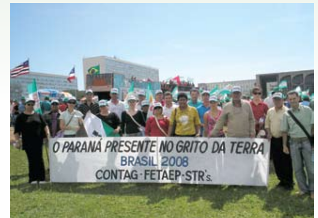
A Fetaep organizou uma caravana formada por cerca de 350 pessoas para o GTB 2008.

Já na área de habitação rural, houve um significativo avanço, pois foram iniciadas as negociações com o governo federal para a criação de um sub-programa destinado especificamente à população rural. A Contag apresentou uma proposta para a construção de 500 mil novas unidades nos próximos cinco anos em todo o País.