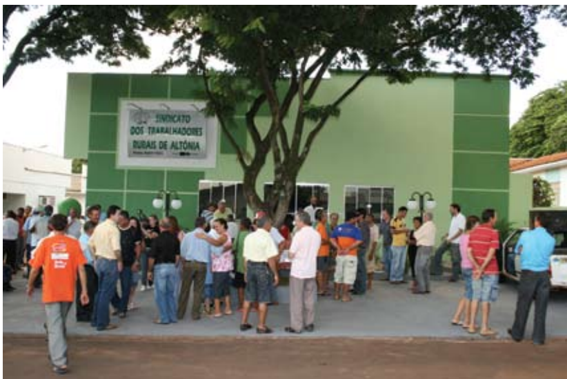
Inauguração contou com a presença da comunidade, lideranças e autoridades

Agora, o sindicato conta com banheiros adaptados para deficientes físicos, dois gabinetes odontológicos, sala de informática, entre outras benfeitorias. Na solenidade de reinauguração foram homenageados os primeiros sócios do STR, ex-presidentes e os primeiros profissionais que prestaram atendimento aos associados, como médicos e enfermeiros. Fundado em 1973, o STR de Altônia tem atualmente cerca de 700 sócios com a mensalidade em dia.