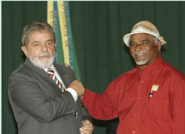
O presidente Lula com o presidente da Contag Manoel dos Santos na audiência em que foram anunciados os resultados do GTB 2008

O governo federal vai destinar R$ 13 bilhões ao plano safra da agricultura familiar 2008/2009 - R$ 1 bilhão a mais que no ano passado. Os recursos foram anunciados dia 14 de abril durante o Grito da Terra Brasil (GTB) 2008 pelo ministro do Desenvolvimento Agrário, Guilherme Cassel, após reunião de representantes de trabalhadores rurais